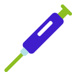
Stap 2 Labtest