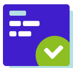
Stap 1 Vragenlijst

Fitte medewerkers die lekker in hun vel zitten zijn productiever en melden zich minder vaak ziek. Daar ben je als werkgever direct bij gebaat. De gezondheidscheck is een praktisch hulpmiddel om jouw medewerkers te helpen om gezonder te leven. Een soort APK-check voor jouw organisatie en medewerkers. Vanuit het onderzoek worden deelnemers doorverwezen naar passende vervolgstappen.